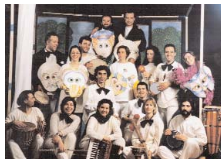
Οι συντελεστές της παράστασης "Ο Πέτρος !!! και ο Λύκος;;;"; (Θεσ/νίκη, 1997)

Ακριβώς αυτή η απλή αλλά ευρηματική επιλογή υλικών και κατασκευών προσθέτουν ένα ιδιαίτερο μαγικό στοιχείο στην τελική εικόνα, κάτι που είναι πάντοτε ζητούμενο σε μια μουσική θεατρική παράσταση για παιδιά ή από παιδιά."