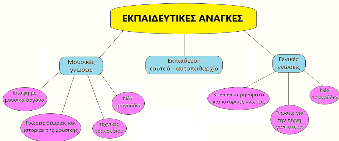
Σχήμα 1. Συνολική απεικόνιση της σχέσης μεταξύ θεμάτων και κωδικών του 1ου ερευνητικού ερωτήματος

Η θεματική ανάλυση των συνεντεύξεων για το ίδιο ερευνητικό ερώτημα ανέδειξε τα εξής θέματα: α) μουσικές γνώσεις, β) γενικές γνώσεις και γ) εκπαίδευση εαυτού – αυτοπειθαρχία (Σχήμα 1).