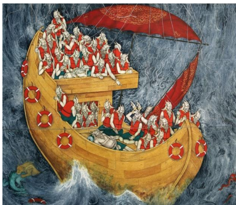
Εικόνα 2: πίνακας παρουσίασης

Οι πίνακες ζωγραφικής αν και αποτύπωναν μία σκληρή εικόνα της προσφυγιάς, ωστόσο οι μαθητές βίωσαν την εμπειρία χωρίς έντονη συναισθηματική φόρτιση. Σε αυτό βοήθησε η παρότρυνση του δασκάλου να εστιάσουν οι μαθητές στα χρώματα των έργων τέχνης (θερμά ή ψυχρά και να τα αναγνωρίσουν) αλλά και στην τεχνική που χρησιμοποιεί ο ζωγράφος.