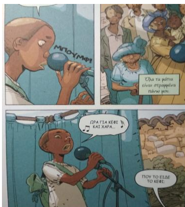
Εικόνα 5: Ο ήρωας του κόμικ τραγουδά

Στο τέλος της διαδικασίας οι ομάδες έδωσαν έναν τίτλο στο τραγούδι, όπως φαίνεται στη συνέχεια: «Ένα όνειρο», «Η αγάπη μου στη χώρα μου», «Τα δικαιώματα των παιδιών», «Το τραγούδι μας», «Ονειρεμένη χώρα». Στη συνέχεια, κάθε ομάδα παρουσίασε τους στίχους που έγραψε στην ολομέλεια της τάξης βελτιώνοντάς τους με την βοήθεια του δασκάλου, όπου χρειαζόταν. Η τελική μορφή των πέντε στροφών υπήρξε αποτέλεσμα ομαδικής ανταλλαγής ιδεών και στίχων προσαρμοσμένων σε έμμετρο λόγο. Παρακάτω δίνονται κάποιες στροφές που δημιούργησαν οι μαθητές σε συνέχεια των στίχων του κόμικ Πρόσφυγες (2017). Οι υπογραμμισμένοι στίχοι είναι ό,τι έγραψαν τα παιδιά.