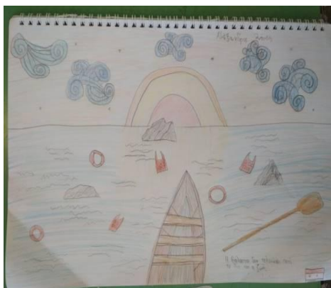
Εικόνα 3: Ζωγραφιά μαθητή