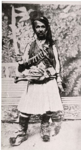
Εικόνα 1 (Μακρής, 1974: 441) Ο Θεόφιλος με ενδυμασία φουστανελά.

Ο Θεόφιλος γεννήθηκε και πέθανε στην Βαρεία Μυτιλήνης το 1935 σε ηλικία περίπου 64 ετών, παρόλο που το μεγαλύτερο μέρος της ζωής του δεν το πέρασε εκεί, αλλά πρώτα στη Σμύρνη και στη συνέχεια στον Βόλο. Υπήρξε ένα πρόσωπο που υπέστη έντονη ψυχοσωματική βία για τη διαφορετικότητα που τον χαρακτήριζε, όπως η αριστεροχειρία του και η επιλογή του να ντύνεται φουστανελάς, μία ενδυμασία που ήταν ξεπερασμένη στην εποχή του (Εικόνα 1) (Ελύτης, 1996· Μακρής, 1974· Τσαρούχης, 1967).