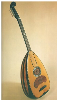
Εικόνα 2 Στεριανό λαούτο (Ανωγειανάκης: 86)

Ο χορός «τσάμικος» αποτελεί κατά βάση έναν αντρικό χορό και είναι ένα είδος που έχει άμεση σχέση με το δημοτικό τραγούδι και μέσω αυτών αναδεικνύεται η γενναιότητα. Αποτελείται από μια ομάδα χορευτών, τουλάχιστον δύο, με βασικό πρωταγωνιστή τον πρωτοχορευτή οι οποίοι κινούνται σε κύκλο. Παρόλο που υπάρχουν μοτίβα και κανόνες που ακολουθούν οι χορευτές, το τσάμικο έχει αυτοσχεδιαστικό χαρακτήρα, δίνοντας την ευκαιρία στον πρωτοχορευτή να εκφραστεί μέσω της κίνησης. Το ζενίθ της έκφρασης των πρωταγωνιστών, πρωτοχορευτή και «κλαριτζή» έρχεται όταν οι δυο τους αυτοσχεδιάζουν, επικοινωνώντας μουσικοκινητικά, στο γνωστό μέρος κάθε τσάμικου που χαρακτηρίζεται ως βέρσο (verso) (Koutsouba, 2014).