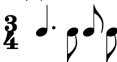
Παράδειγμα 2 2 Παραλλαγή τσάμικου

Στο σημείο αυτό, η ορχήστρα τραγουδάει ομαδικά σε ταυτοφωνία από την αρχή του τρίτου στίχου, σε ένα νέο γύρισμα, αυτή τη φορά όμως σε ρυθμική κανονικότητα και ρυθμό 3/4 τσάμικο (βλ. Παράδειγμα 2) σε ταχύτητα 102bpm το τέταρτο, ο οποίος είναι αρκετά συντηρητικός χωρίς ιδιαίτερες παραλλαγές. Στη μέση του τέταρτου στίχου ακολουθεί εισαγωγή 9 μέτρων. Αυτή η φόρμα επαναλαμβάνεται ακόμη τρεις φορές όπου ολοκληρώνονται οι στίχοι και ακολουθεί αυτοσχεδιασμός (verso) από το κλαρίνο που στηρίζεται στη ρυθμική ροή για τουλάχιστον 16 μέτρα, καθώς το βίντεο διακόπτεται και δεν παρουσιάζεται το κλείσιμο του τραγουδιού.