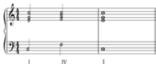
Σχήμα 3: Σύνδεση συγχορδιών I-IV-I