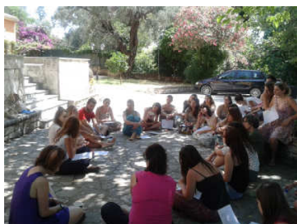
Στιγμιότυπο από το σεμινάριο στον κήπο της Εθνικής Πνακοθήκης - Παράρτημα Κέρκυρας