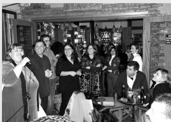
9-2-08: Κοπή της βασιλόπιτας της Ε.Ε.Μ.Ε. στο μπαράκι Cohiba. Και του χρόνου!