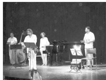
Οι “ Plaza Ensemble ”