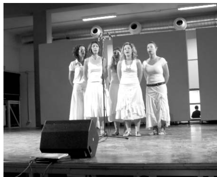
Το γυναικείο πολυφωνικό σχήμα "Διώνη"