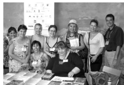
Ραντεβού το 2010 στο Περίνιο!