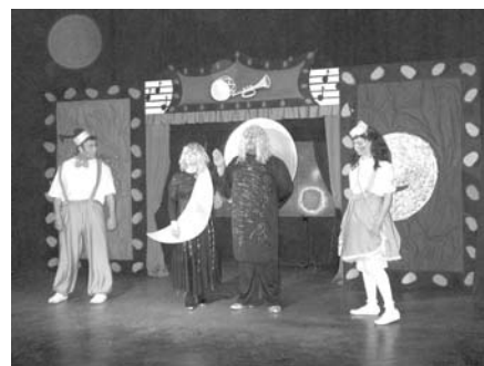
Σκηνή από τη θεατρική παράσταση “ Τύμπανο, τρομπέτα και κόκκινα κουφέτα ”

Στη συνέχεια, στη σ. 4 των Νέων , μπορείτε να βρείτε περιληπτικά τα πρακτικά της 12ης Τακτικής Γενικής Συνέλευσης που πραγματοποιήθηκε στο πλαίσιο της διημερίδας.